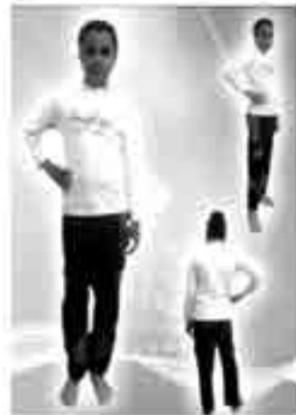
شکل ۴- اتود رنگی طرح (۲)