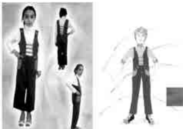
شکل ۳- اتود رنگی تأیید شده طرح (۱)