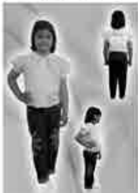
شکل ۸- اجرای نهایی طرح (۶)