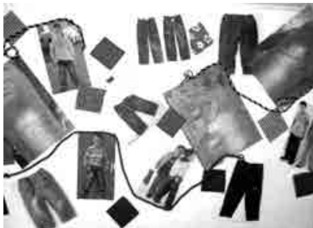
شکل ۱- استوری برد

در قسمت جلو از بارجه ای به رنگ سرخابی به صورت پلیسه استفاده شده و قسمت پشت بالاتنه نیز همانند جلو می باشد ز جیب روی باسن قرار دارد و همچنین از برش های منحنی در جلو و پشت لباس استفاده شده است که به وجود آورنده تحرک و پویایی کودک می باشد و این لباس در قسمت سر شانه با دکمه بسته می شود و در پایین تصویر نمونه پارچه سازی به صورت پیلی آورده شده است.