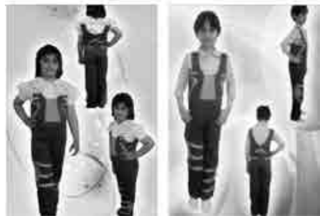
شکل ۵- اجرای نهایی طرح (۳)

این طرح مناسب سن ۱۰ سال دختر می باشد در این طرح در پایین شلوار از جین های ریز با حریر استفاده شده و به خاطر این صورتی انتخاب شده چون حالت شاد بودن را به کودک القا میکند همچنین بر روی این شلوار دامن کلوش طراحی شده و کمر این دامن کش دوزی شده و این به خاطر این کش دوزی شده است تا کودک به راحتی بتواند از آن استفاده کند و در این شلوار از زیپ فلزی به خاطر جذاب بودن آن در لباس استفاده شده است و همچنین از قابلیت های این لباس این است که می توان آن را بدون دامن یا با دامن پوشید.