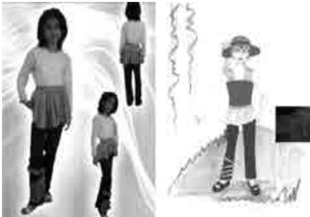
شکل ۴- اتود رنگی طرح (۴)