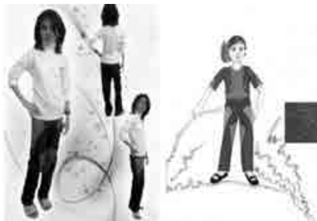
شکل ۷- اتود رنگی طرح (۵)